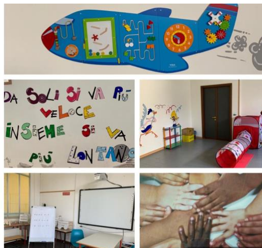
SCUOLA RIGUTINI VIA DELLA RIOTTA,1