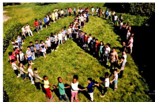
SCUOLA DON PONZETTO VIA PIANCA 37

ISTITUTO COMPRENSIVO BELLINI OPEN DAY 14/12/2020 ore 16.45